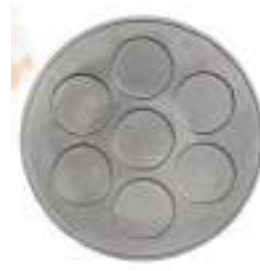
7'Li KALIP 7 SHAPE PLATE