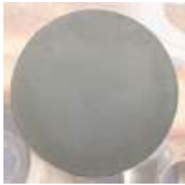
DÜZ KALIP FLAT PLATE